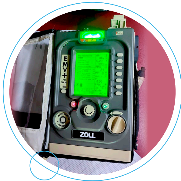
Contamos con equipos de ventilación mecánica marca Zoll EMV