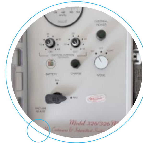
Aspirador portátil marca Impact