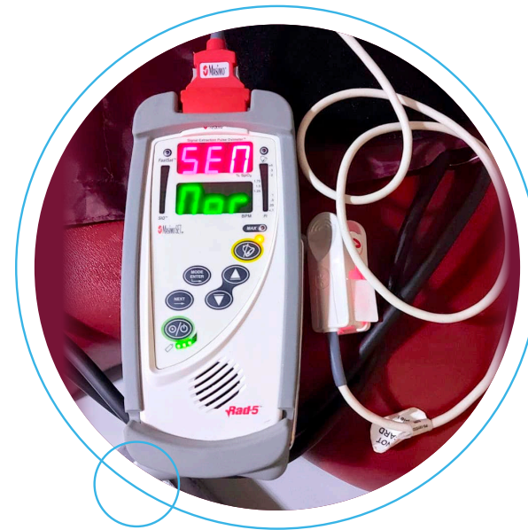
Oxímetro marca Masimo para una confiable lectura de signos vitales