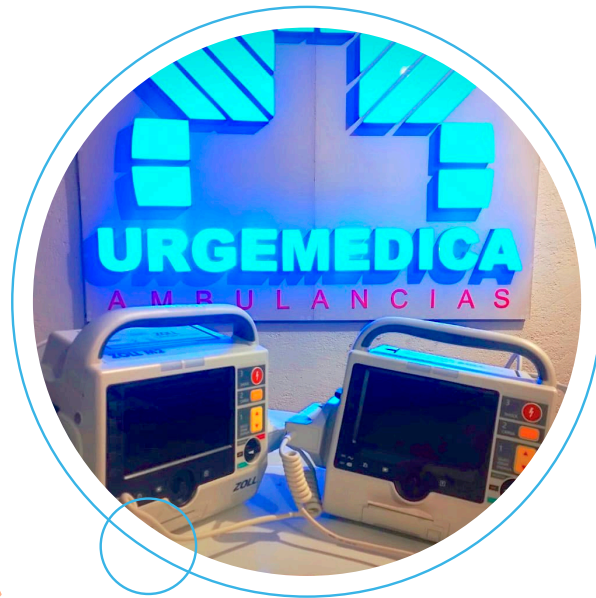
Desfibrilador monitor marca Zoll serie M2