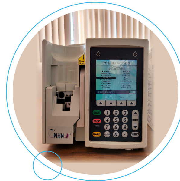
Bomba de infusión de dos vías marca Plum-A