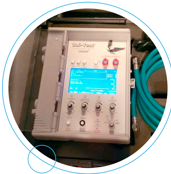
Equipos de ventilación mecánica marca Impact Univent